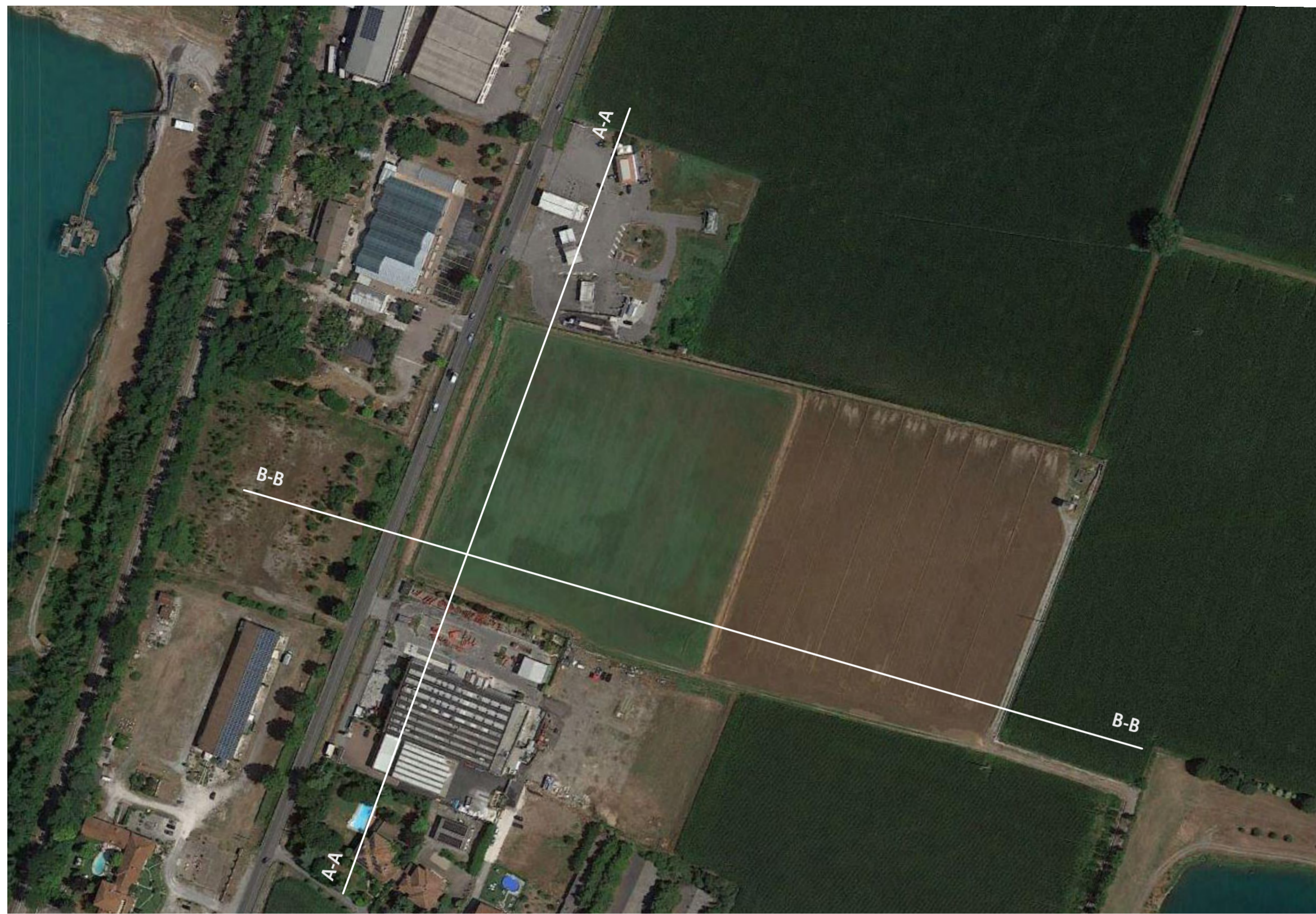
ORTOFOTO _ STATO DI FATTO Scala 1:2.000