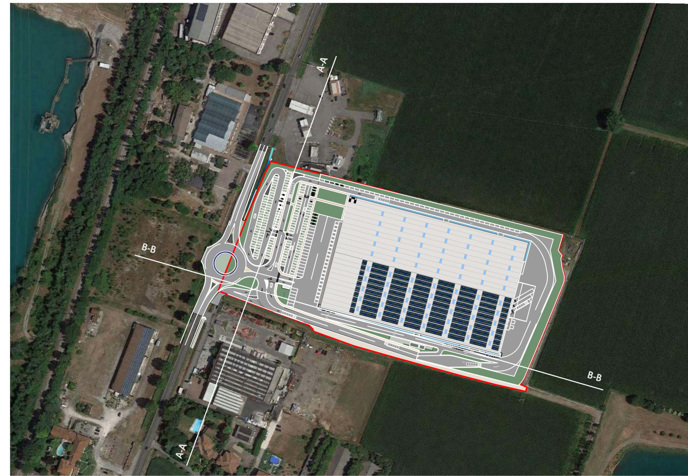
ORTOFOTO _ STATO DI PROGETTO Scala 1:2.000