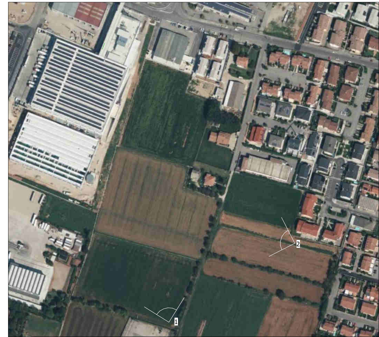
FOTOINSERIMENTO SU ORTOFOTO E RIPRESE FOTOGRAFICHE