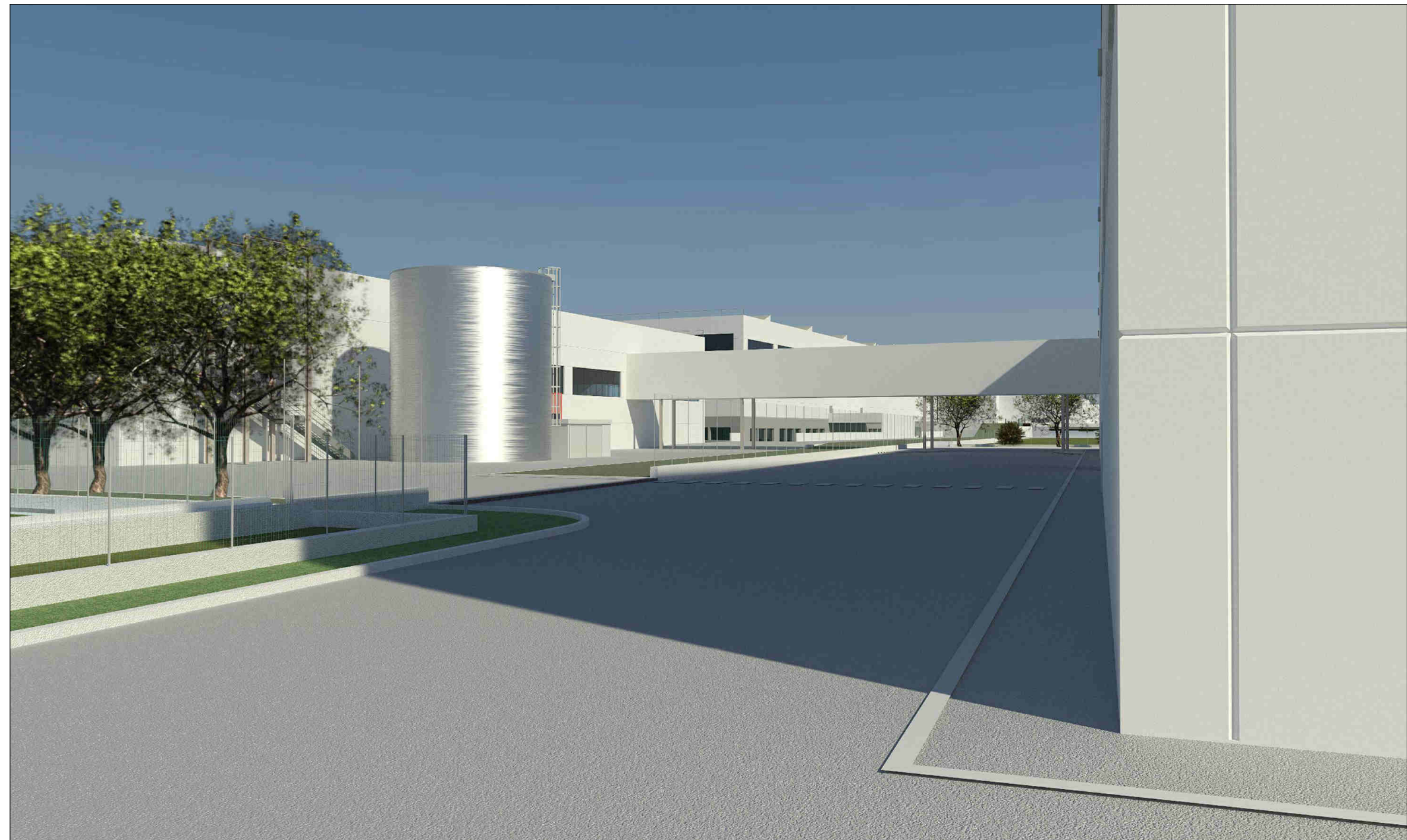
RENDER - TUNNEL DI COLLEGAMENTO AEREO